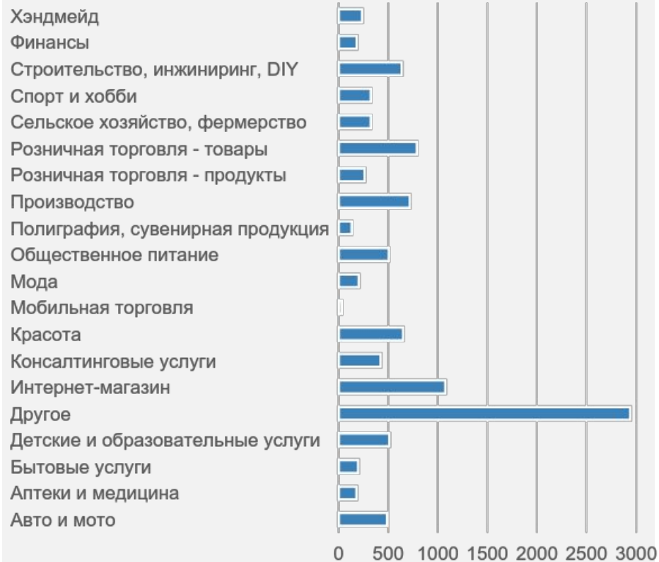
Количество регистраций по сферам бизнеса